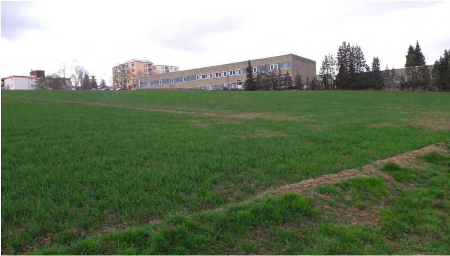
Abb. 7: Blick von Nordosten über die ackerbaulich genutzten Flächen des Plangebiets