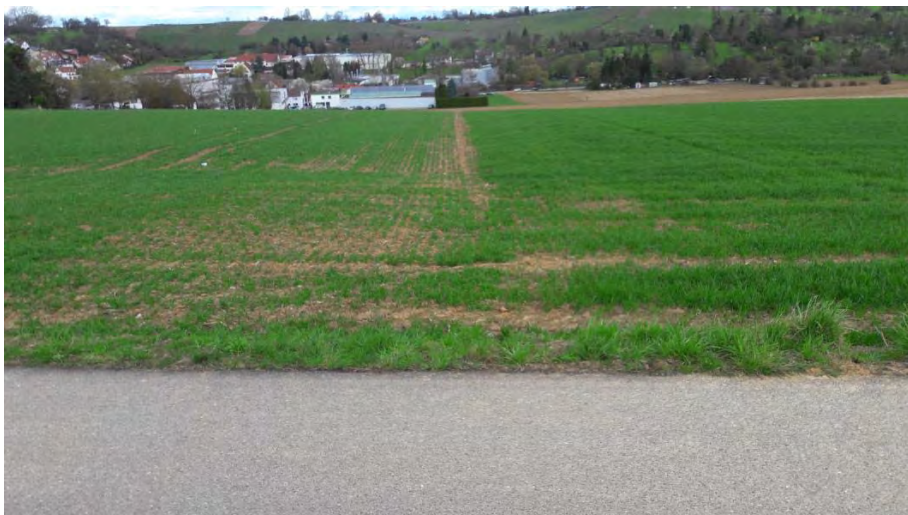
Abb. 5: Blick vom Radweg aus Richtung Norden