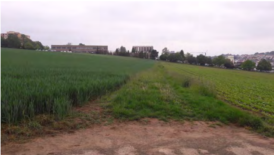
Abb. 8: Bruthabitat der Schafstelze