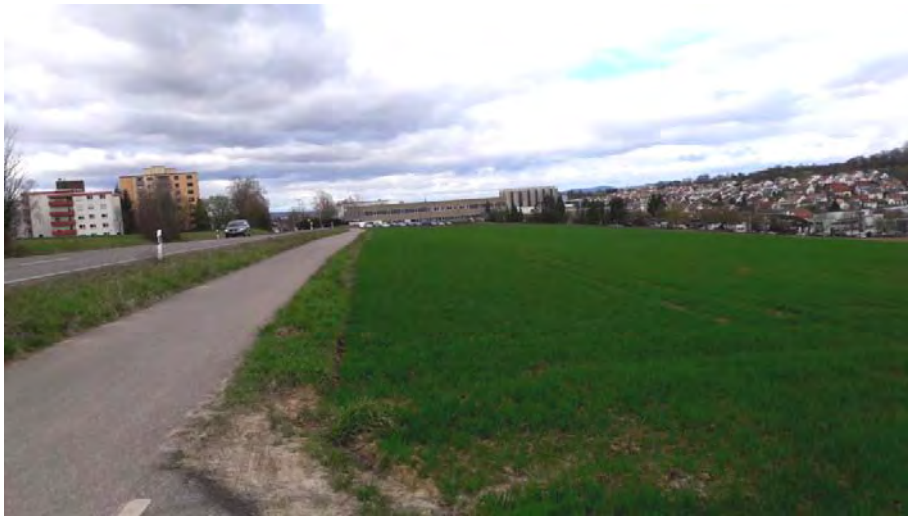
Abb. 4: Blick von Südosten, links der Radweg entlang der K 1603