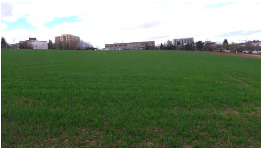
Abb. 3: Blick aus Osten in Richtung Marbach