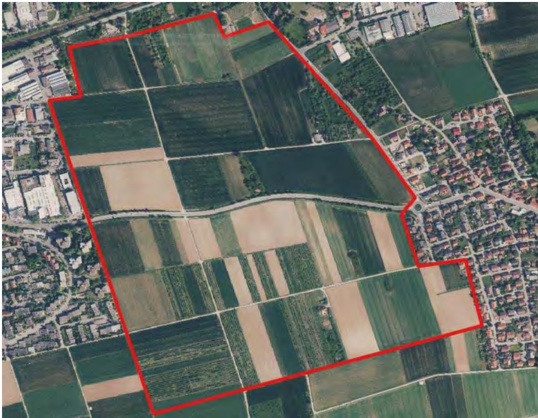
Abb. 2: Abgrenzung Untersuchungsgebiet