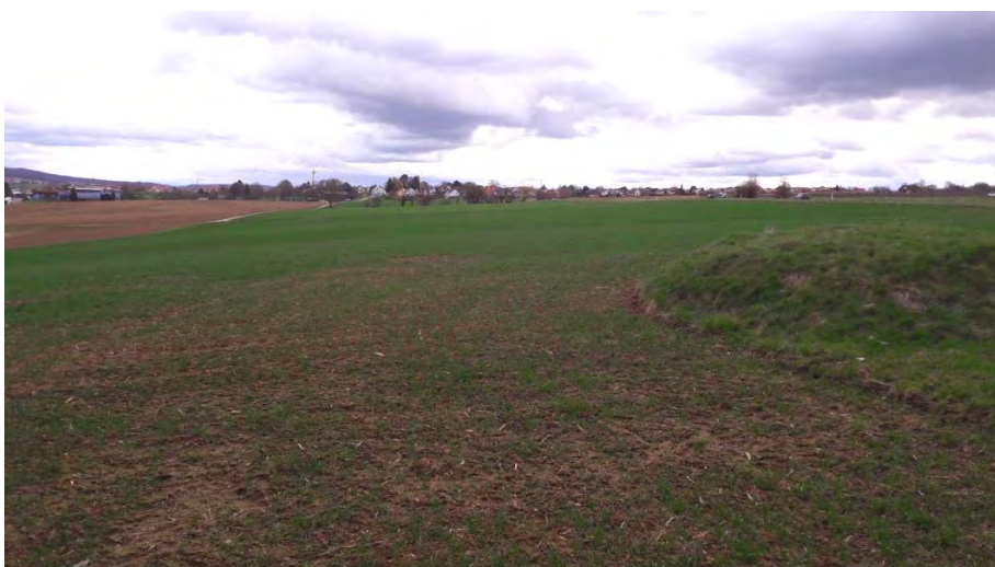
Abb. 6: Blick von Westen, im Hintergrund Erdmannhausen